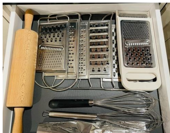
- Koch – und Schöpfutensilien / Schwingbesen / Salatbesteck / Gemüsereiben / Wallholz