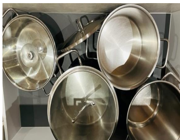
- Töpfe / Bratpfannen / Sauteusen in verschiedenen Grössen