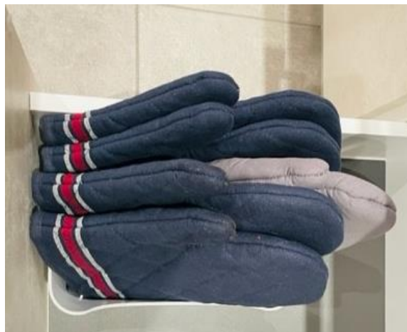
- 4 Backbleche / 2 Gitterroste / Topfhandschuhe